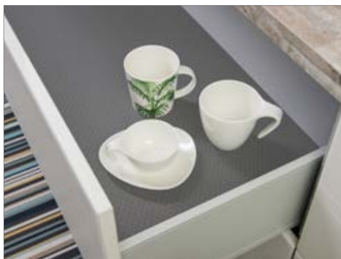
Rys. 5-1 RAUVISIO grip z oklejonymi krawędziami

Zwrócić szczególną uwagę na ustawienia cykliny płaskiej (klejowej) która z powodu właściwości antypoślizgowych powierzchni może ją zarysować. Zaleca się wcześniejsze wykonanie prób lub wyłączenie cykliny płaskiej.